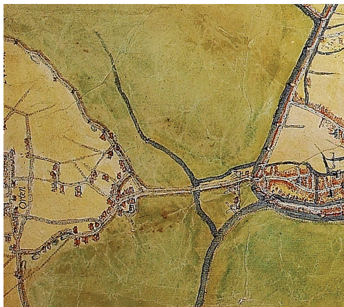
Uitsnede van de kaart van Jacob van Deventer (1545) van het gebied rond de Orthenpoort en het zuidelijk deel van Orthen. (Origineel: Koninklijke Bibliotheek Brussel;)