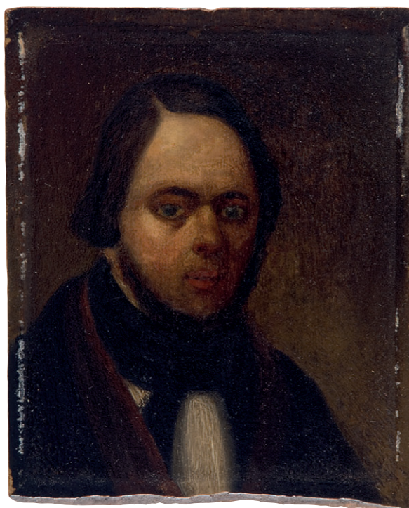
Afb. 6. Jan Hendrik van Grootvelt, Zelfportret, circa 1850. Olieverf op paneel, 13,3 x 11 cm. (Particulier bezit)

Jan Hendrik van Grootvelt exposeerde in 1828 op de eerste tentoonstelling van Levende Meesters in 's-Hertogenbosch. Deze door koning Lodewijk Napoleon geïntroduceerde landelijke exposities – voor het eerst in 1808 in Amsterdam gehouden – waren dé gelegenheid voor kunstenaars om hun werk aan een groot publiek te tonen. Op 15 september 1828 werd de 'vaderlandsche tentoonstelling' in 's-Hertogenbosch geopend met de 'uitdeeling der eerebeloningen (die) met den meesten luister plaats (had)'. 'In den vroege morgen werdt deze plegtigheid zoo