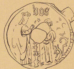
Afb. 1.3 Tekening: BAM