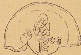
Afb. 1.2b Tekening: BAM