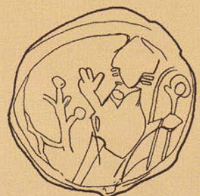
Afb. 1.4 Tekening: BAM