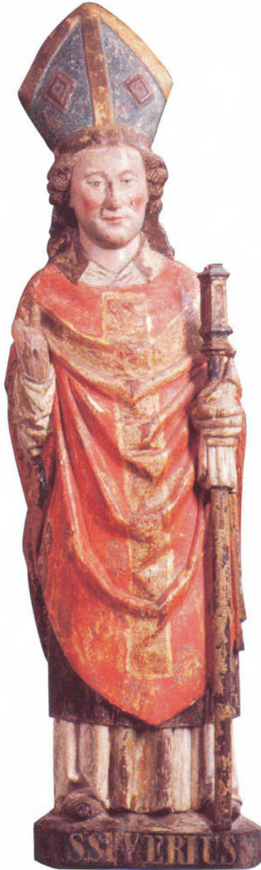
Afb. 2. Beeld van Sint Sever(i)us, ca. 1490. Noordbrabants Museum, ca. 90 x 25 cm.

Zo wordt op een aantal kleine loden (kleine keur) Johannes de Evangelist, de patroonheilige van de Sint-Janskerk, weergegeven (afb. 1.1). Eén van de grote loden, een grote keur, is voorzien van de letters bos aan weerszijden van een voorstelling van Johannes de Evangelist, vergelijkbaar met bovenvermelde oorkonde (afb. 1.2).